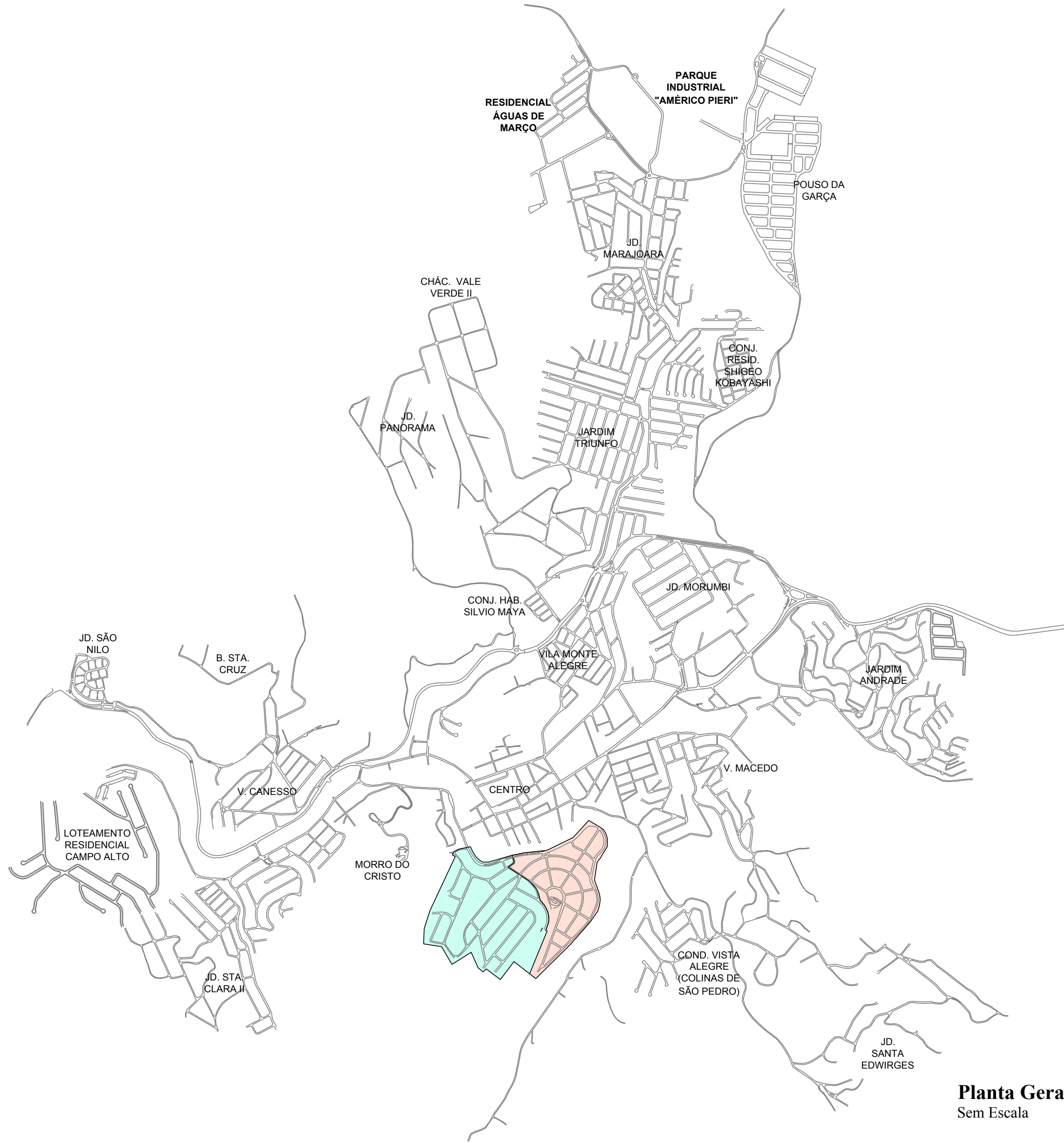
Planta Geral Sem Escala